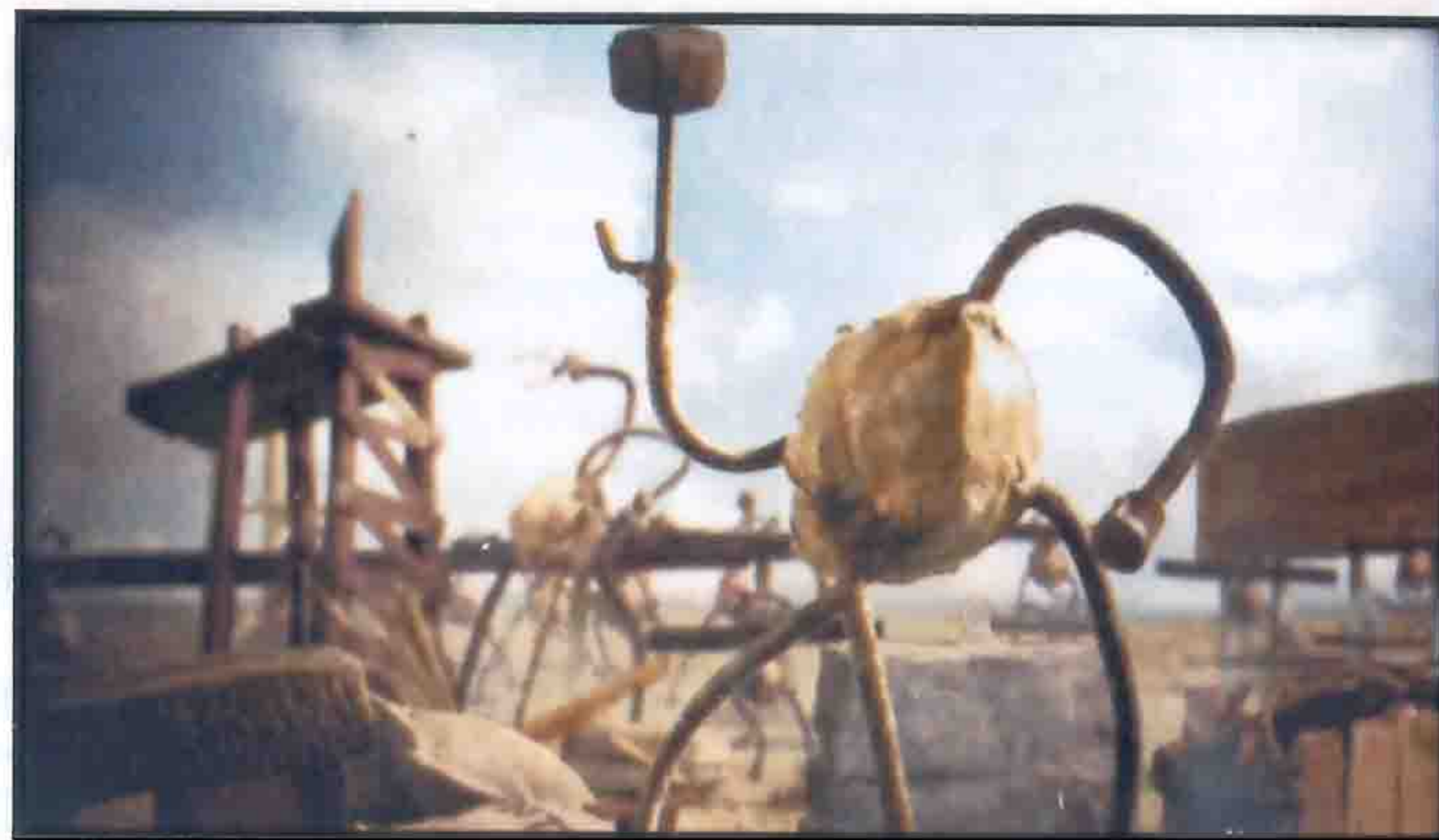
Cosa a réalisé le clip de New Found Glory aux États-Unis.

Projet apporté et réalisé par Yannis Mangematin (à qui l'on doit des clips de NTM), ces Battlegrounds ont d'abord été diffusées sur MCM et seront disponibles en DVD dès le 15 novembre dans les magasins Footlocker (à hauteur de 100 000 pièces).